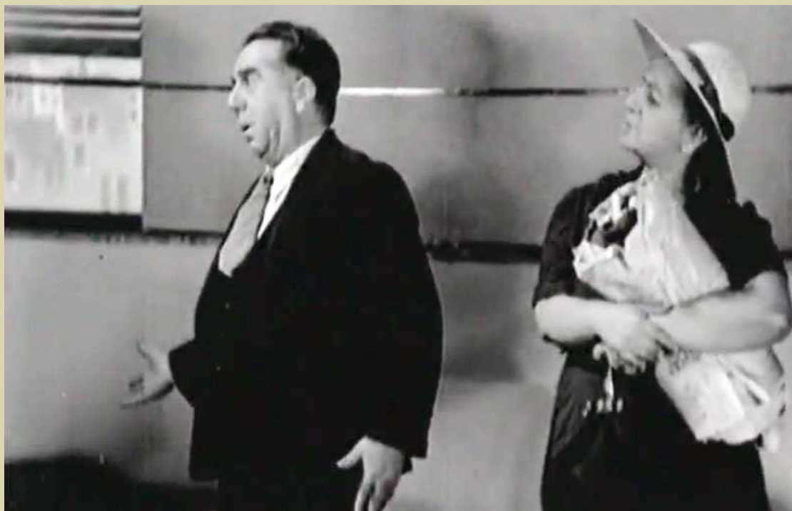
Νίκος Τσιφόρος: Σεναριογράφος